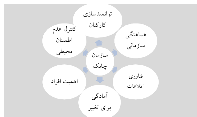
شکل (۲): مدل مفهومی پژوهش

با در نظر گرفتن پیشینه تحقیق، مدل‌های مرتبط و شاخص‌های اصلی موضوع چابک‌سازی سازمان، مدل اولیه مفهومی نظری تحقیق متأثر از دیدگاه گلدمن و ناگل در مورد چابکی سازمانی به شکل نمودار زیر مفروض خواهد بود: